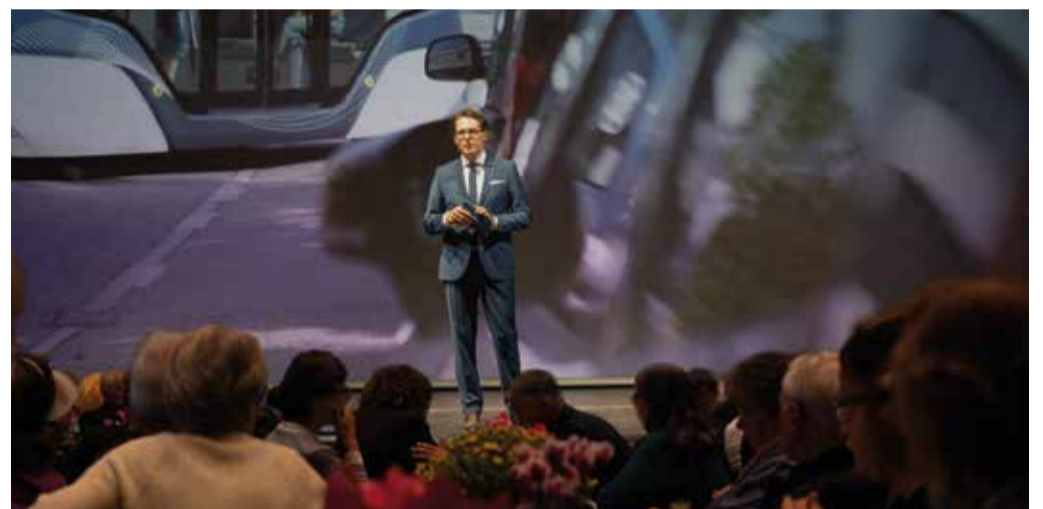
Die Bürgerversammlung findet in der Stadthalle 1 statt. Damit aber alle Interessierten der Veranstaltung beiwohnen können, wird sie zudem live online übertragen.

Neben spannenden Diskussionen und Präsentationen haben die Deggendorferinnen und Deggendorfer wieder die Möglichkeit, tolle Preise von Deggendorfer Vereinen zu gewinnen. Auch