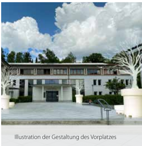
Illustration der Gestaltung des Vorplatzes

Die Gebäudeanlage unseres Neuen Deggendorfer Rathauses stellt ein überzeugendes Beispiel einer bewussten und attraktiven Ensemblegestaltung dar.