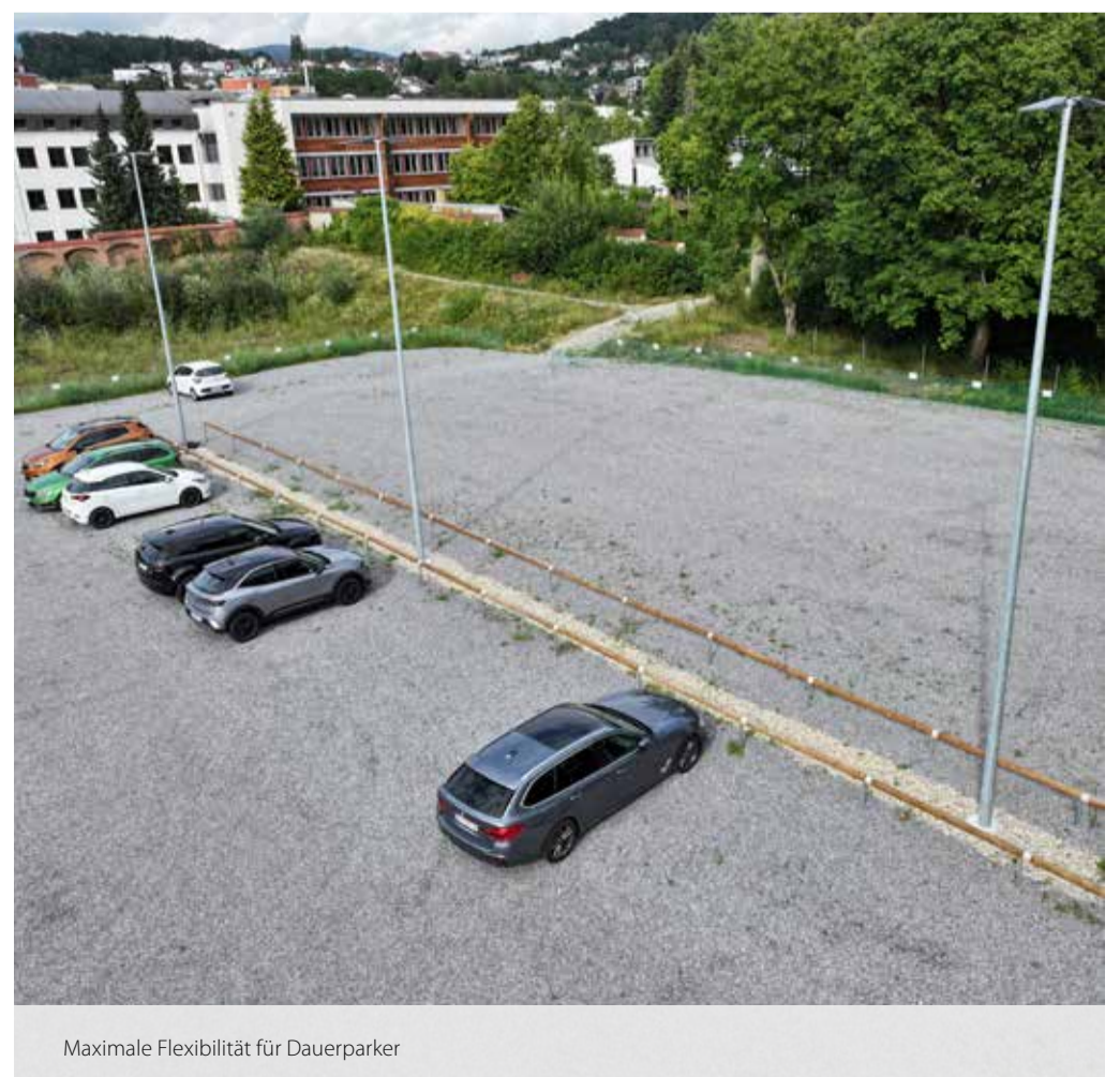
Maximale Flexibilität für Dauerparker

Melden Sie sich einfach unter 0991/370830 oder füllen Sie den entsprechenden Antrag zur Anmietung auf unserer Homepage aus!