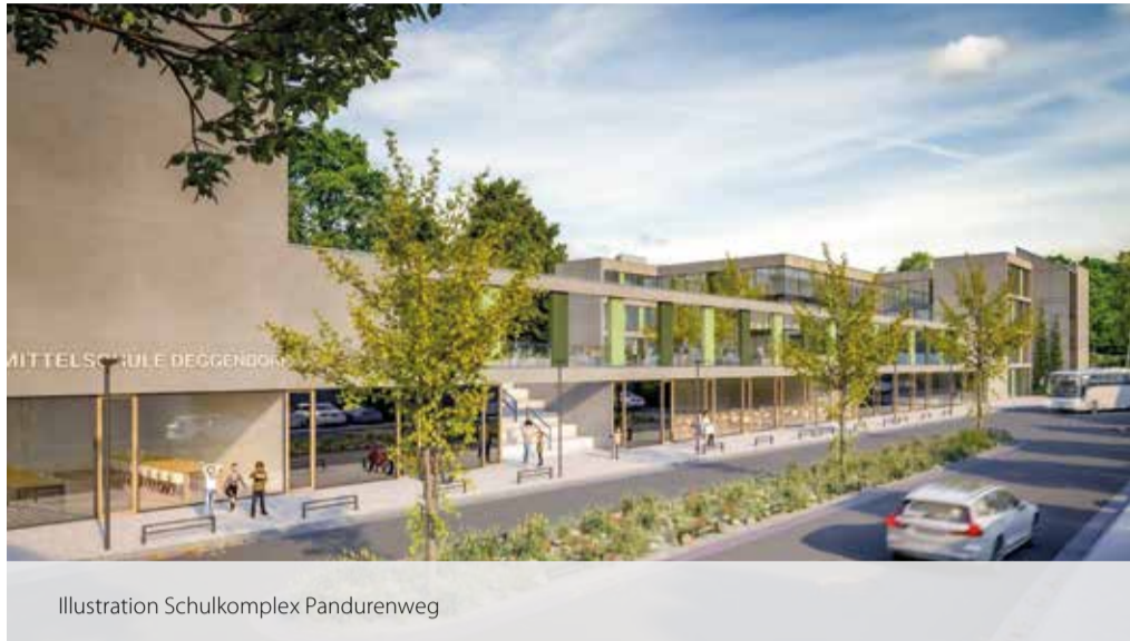
Illustration Schulkomplex Pandurenweg

Das immer stärker werdende Bewusstsein für Nachhaltigkeit und Sparsamkeit im Umgang mit vorhandenen Ressourcen bewog die Verantwortlichen jedoch die Machbarkeit und Wirtschaftlichkeit einer Sanierung des bestehenden Schulgebäudes zu untersuchen. Nachdem diese Variante als gut und richtig beurteilt worden war, war es nur konsequent, auch die Mittelschule Theodor Heuss diesbezüglich zu betrachten. Im Zuge dessen stellte sich die Frage, ob es zudem möglich wäre, die ebenfalls sanierungsbedürftige Mittelschule St. Martin am Standort Pandurenweg zu integrieren.