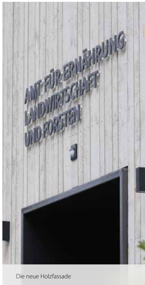
Die neue Holzfassade

Nachdem mit der Sparkasse der letzte Mieter im November 2022 auszog, konnten anschließend die Vorbereitungsarbeiten starten. Ab März 2023 wurde mit der Errichtung des Dachgeschosses in Holzbauweise begonnen. Der Vorteil dabei ist nicht nur, dass Holz statisch leichter ist als andere Materialien, sondern auch, dass bei dieser Bauweise viel