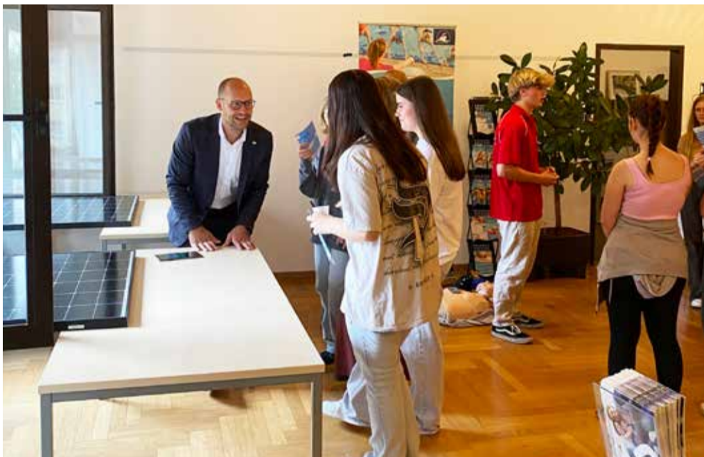
Die Besprechungsräume der Stadtwerke wurden kurzerhand in einen Energie-Marktplatz umfunktioniert, um den Schülerinnen und Schülern die vielfältigen Aspekte der Energieversorgung näherzubringen.

Ein weiteres Highlight ist das große Jubiläumsgewinnspiel mit Preisen im Gesamtwert von über 1.500 Euro. Hauptgewinne sind ein Balkonkraftwerk, ein E-Scooter und ein Power Fox (Auslesegerät für Stromzähler). Zudem gibt es einen SodaStream, 3x 500 kWh Stromgutschrift, Powerbanks sowie Gutscheine und Bonuskarten für das elypso Freizeit- und Erlebnisbad zu gewinnen. Die Teilnahme ist online möglich, und weitere Informationen zu den Jubiläumsaktionen sind unter www.stadtwerke-deggendorf.de zu finden.