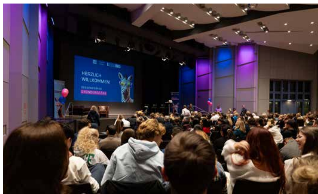
Erster Deggendorfer Gründungstag in den Deggendorfer Stadthallen

Für diejenigen, die als Besucher am Gründungstag teilnehmen, ist es eine ideale Gelegenheit, die besten Nachwuchsunternehmen und Gründungsexperten aus der Region kennenzulernen. Die Finalisten aus dem Wettbewerb um den Deggendorfer