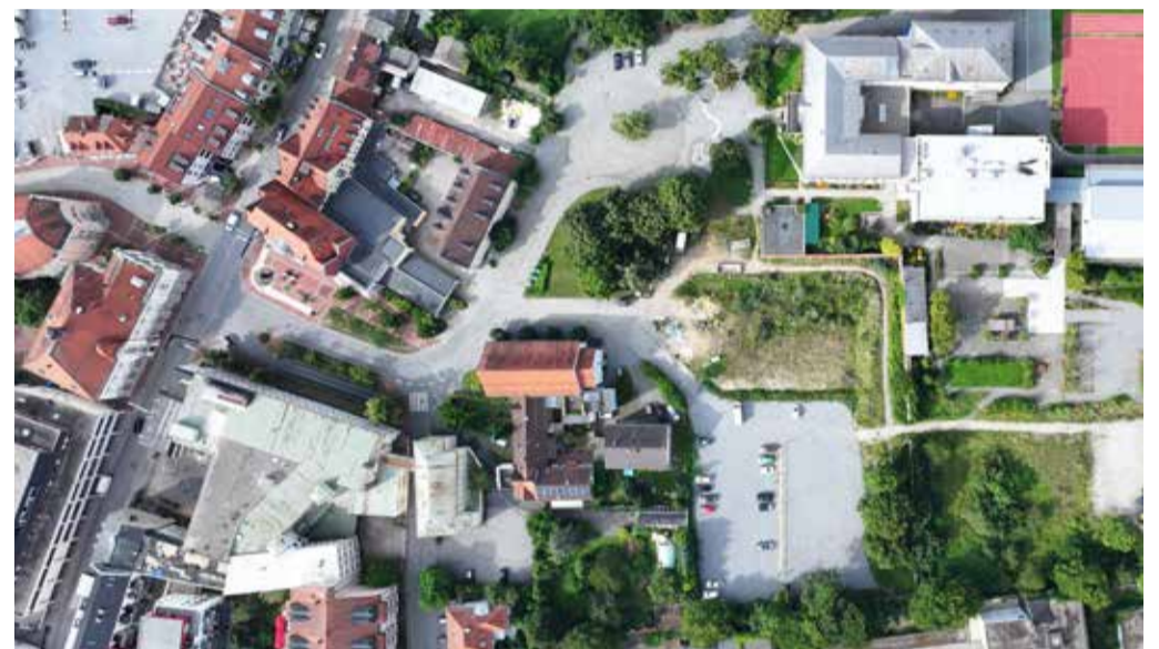
Neuer Parkplatz in Zentrumsnähe

Wir laden Sie herzlich ein, diese Gelegenheit zu nutzen und sich einen Stellplatz in bester Lage zu sichern! Die Kombination aus der Nähe zum