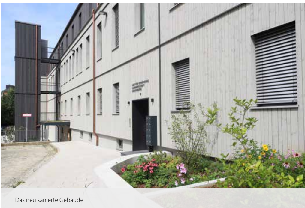
Das neu sanierte Gebäude

vorgefertigt werden kann, was einiges an Zeit spart. Innerhalb etwa eines Jahres Bauzeit wurde so das alte Gebäude komplett entkernt und auf KfW-40-Standard mit Wärmepumpe, Fußbodenheizung, zentraler Lüftung und Kühlung sowie PV-Anlage gebracht. Dadurch können in Zukunft schätzungsweise 80 % der Energiekosten gespart werden. Im Inneren sorgen der geölte Eichenboden und die neuen, modernen Büromöbel dafür, dass sich nicht nur die Mitarbeiterinnen und Mitarbeiter, sondern auch die Besucherinnen und Besucher wohl fühlen. Durch den Anbau eines Aufzugs ist das rund 2000 m 2 große Gebäude nun auch barrierefrei. In der Gesamtbeurteilung gelang es in Zusammenarbeit mit dem Architekturbüro Hammerl in herausragender Weise die vorhandene Bausubstanz zu erhalten und zu verbessern sowie das Potential des Gebäudes ideal auszuschöpfen.