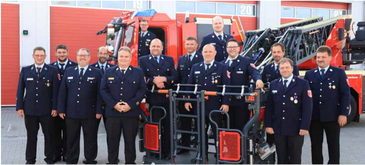
Kommandanten und stellvertretende Kommandanten der Feuerwehr Deggendorf und der Stadtteilfeuerwehren