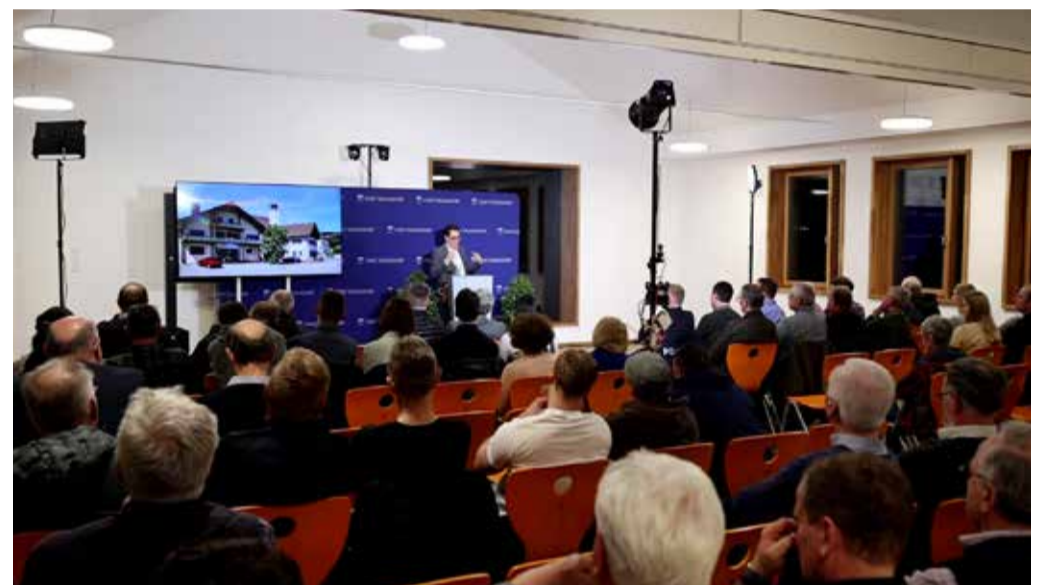
Nur ein Teil der Besucher - Bürgerinnen und Bürger können auch online teilnehmen.

Vereinsheim Fischerdorf, Unterer Sommerfeldweg 7